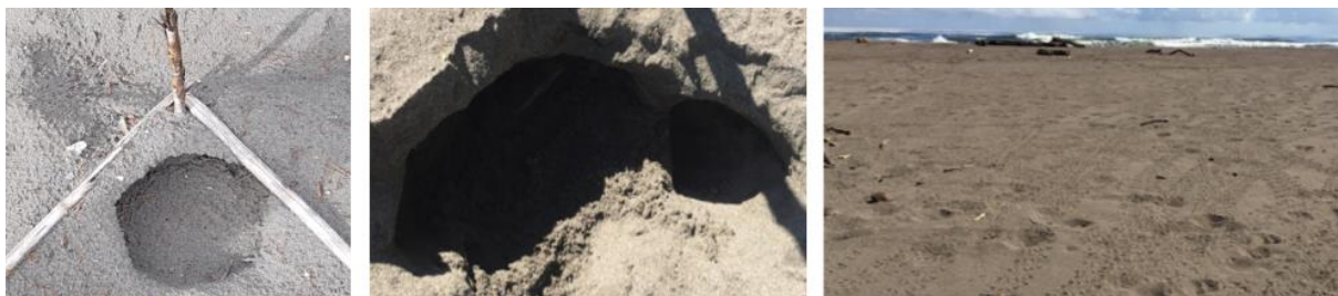
Fig. 3: Ejemplos de “palos de depresión” con depresión activa (izquierda), hueco de crías (centro), y rastros de crías después de emergencia (derecha).

Chequeo de depresión: la tortuga carey tiene un promedio de incubación de 60 días, de un rango de 47-75 días (Chacón et al. , 2007). En Playa Norte, durante la temporada de 2017 el promedio periodo de incubación fue 61 días (Gutiérrez, 2017). En el día 55 de incubación los nidos son triangulados de nuevo y se sitúan los “palos de depresión” (fig. 3) para facilitar la búsqueda de señales de depresión o crías. Indicaciones de actividad de crías incluyen depresión en la arena cerca del centro del nido por las crías saliendo a la superficie (fig. 3), un hueco como una cueva donde las crías han salido (fig. 3) y rastros de crías saliendo el nido para el mar (fig. 3). Una depresión es confirmada por enterrar un palito en el área de depresión y la arena debajo de la superficie se caiga.