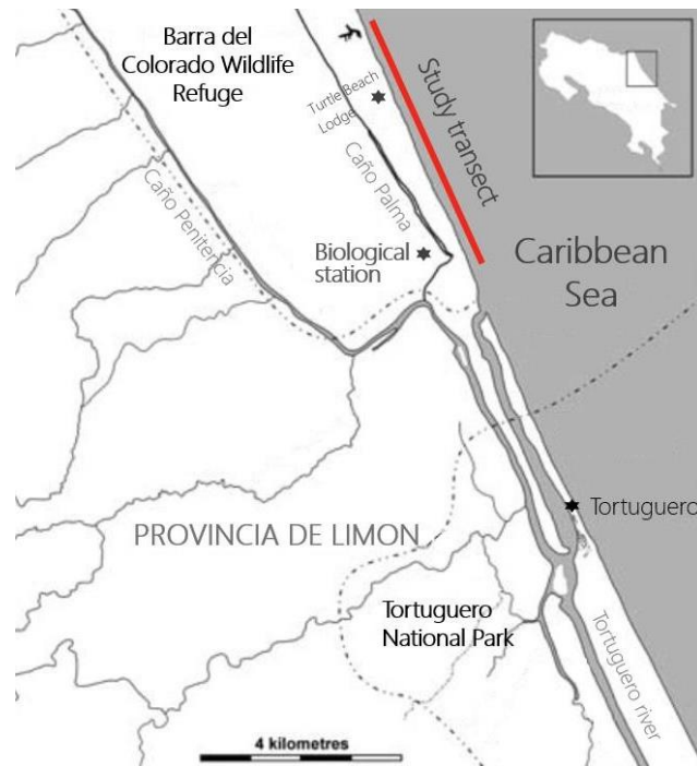
Fig. 1: Mapa descriptivo del 3 1/8 th milla transecto de estudio, indicado en rojo, y la ubicación de la Estación Biológica Caño Palma (adaptado por Grant & Lewis, 2010).

A lo largo de la playa se situaron marcadores de milla permanentes cada 1/8 de milla para facilitar la orientación y permitir la realización del análisis de distribución espacial. Estos marcadores fueron recolocados y pintados en febrero, y el proceso se repitió a lo largo de la temporada siempre que fuera necesario. Las coordenadas GPS fueron registradas mediante un dispositivo Garmin GPSMAP 62S para los análisis espaciales. La playa está dividida verticalmente en tres zonas (Fig. 2), que son diferenciados por cantidad de sombra, abierta (0%), borden (50%), y vegetación (100%). Estas zonas están usadas para analizar la distribución espacial de nidos por el axis vertical de la playa.